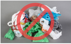
Túi và màng bọc nhựa

Không để các đồ vật này vào xe đẩy đựng rác tái chế của quý vị Các đồ vật sau không thể tái chế được và chỉ làm tăng ô nhiễm trong quá trình tái chế của chúng tôi.