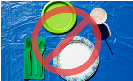
Đĩa giấy, cốc giấy, khăn ăn, ống hút giấy và đồ dùng ăn uống bằng giấy