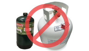
Bình khí nén (propan, heli, CO 2 )

Có sẵn các tùy chọn tập kết rác tái chế cho một số những đồ vật nêu trên. Hãy kiểm tra Green Disposal Guide của Hennepin County tại hennepin.us/green-disposal-guide