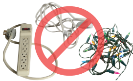
Những đồ vật dễ rơi như dây điện, đèn trang trí ngày lễ và ống nước