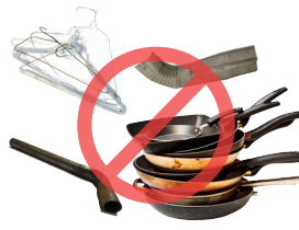
Đồ vật kim loại ngẫu nhiên