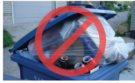
Rác tái chế để trong túi