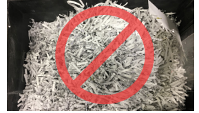
Giấy xén vụn