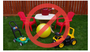
Đồ vật và đồ chơi lớn bằng nhựa