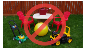
Artículos grandes de plástico y juguetes