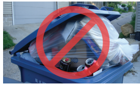
Reciclaje en bolsas