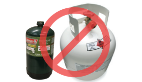
Cilindros presurizados (propano, helio, CO2)

Existen opciones de reciclaje para algunos de estos artículos. Consulte la Green Disposal Guide de Hennepin County en hennepin.us/green-disposal-guide