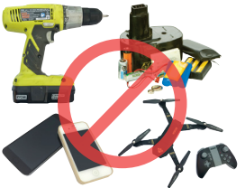
Aparatos electrónicos y pilas