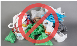
Bacaha balaastikada ah iyo duubaha

Waxyaabaha soo socda dib looma warshadayn karo oo kaliya waxay wasakh ku daraan nidaamka dib u warshadaynta walxaha.