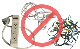
Tanglers sida xadhkaha korontada, nalalka fasaxa, iyo tuubooyinka