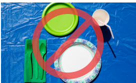
Saxamada warqada ka sanaysan, koobabka, istiraashooyinka, dhuumaha, iyo maacuunta