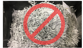
Warqadaha la jarjaray