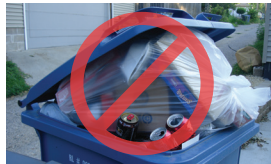
Dib u warshadaynta baagaa