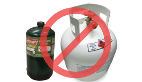
Dhululubada la cadaadiyo (propane, helium, CO2)

U qaad ikhtiyaarada loo heli karo in dib loogu warshadeeyo qaar ka mid ah alaabtan. Ka fiiri Hennepin County Green Disposal Guide hennepin.us/green-disposal-guide